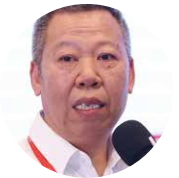
郑文革 中国科学院 主任