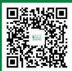
海名餐饮供应链系列展 公众号