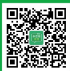
餐饮供应链优选 公众号