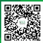
海名餐饮供应链系列展 视频号