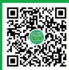
餐饮供应链优选 视频号