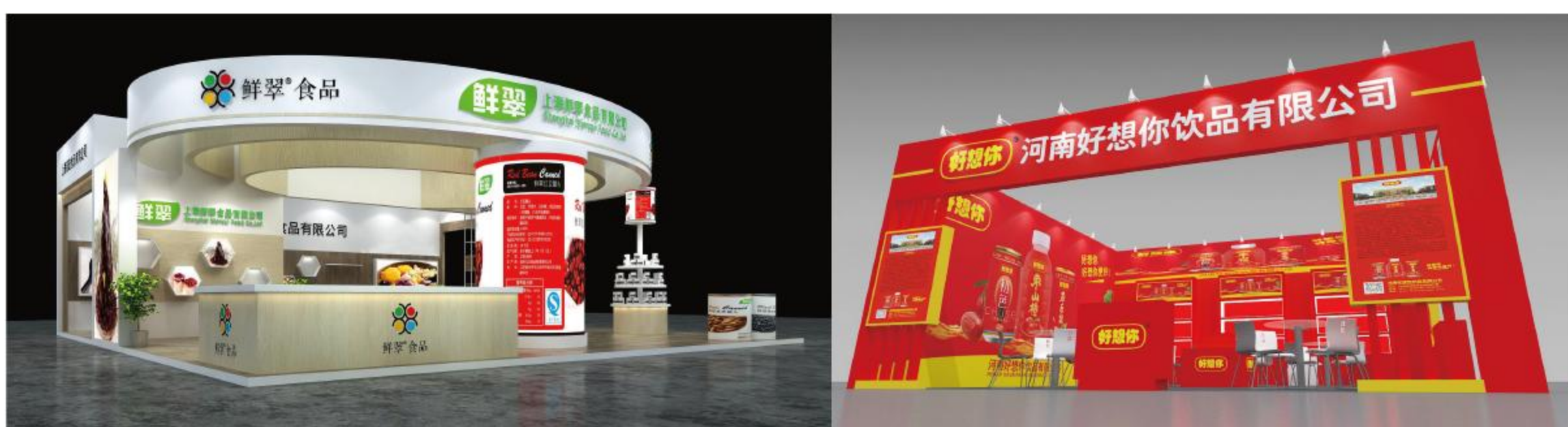
注：由展商自行报馆、搭建和布展。