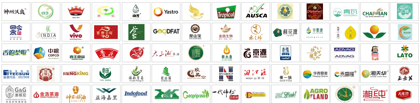
(以上为历届部分参展品牌, 排名不分先后)