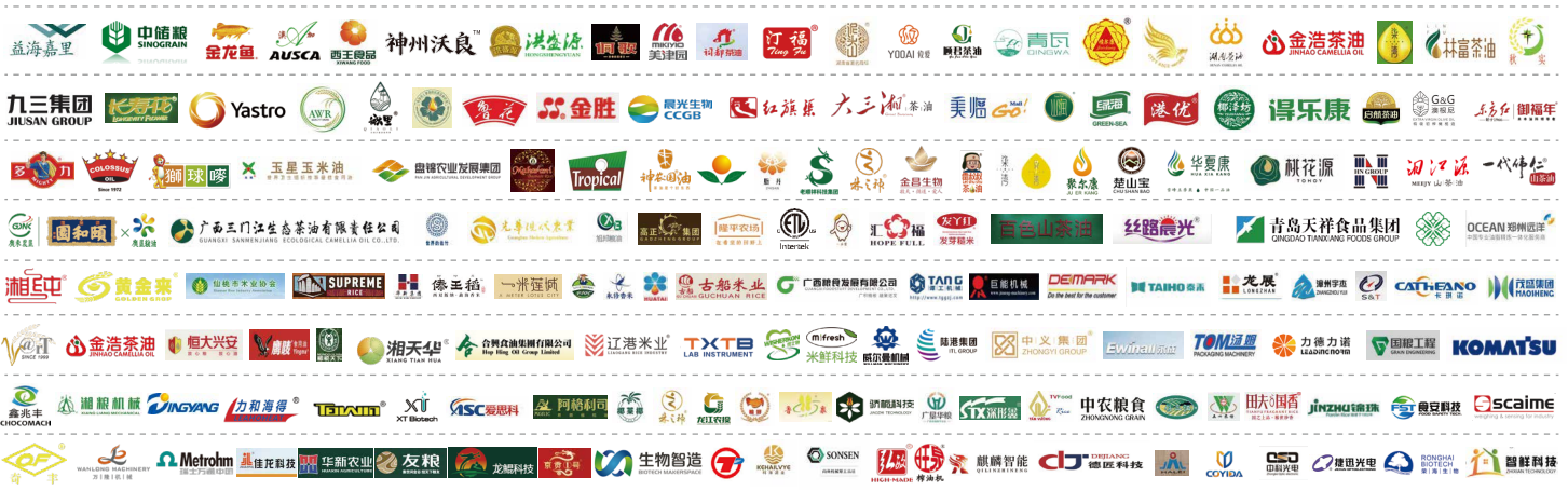
(以上为历届部分参展品牌)