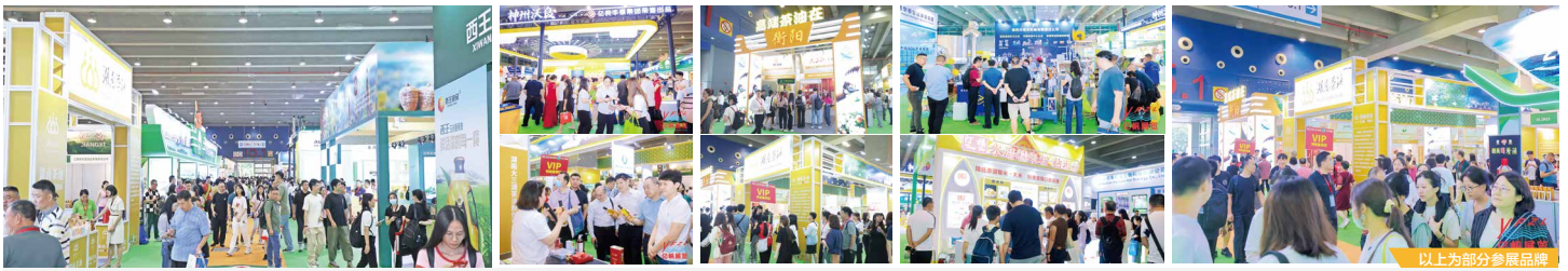
以上为部分参展品牌

IGO世界粮油展是由广州国际食用油产业博览会 (IOE世界油博会)、广州国际优质大米及品牌杂粮展览会 (IRE大米杂粮展)、广州国际粮油机械及包装设备展览会 (IGME粮油机械展) 三大主题展组成, 三展有效联动, 整合各方优势资源。展会以深入推进粮油品牌化建设, 引领粮油产业提品质、树品牌、强产业为宗旨, 旨在推动优质区域公用品牌和企业品牌培育和宣传, 提升品牌知名度和影响力, 助推粮油产业经济高质量发展。展会聚焦加速全国粮油流通, 创新粮油产业对接模式, 构建产业链高效商贸链路, 推动粮油产业“产购储加销”全产业链优化升级, 以专业化、品牌化、国际化的发展方向为粮油产品和机械设备企业开拓和巩固国内外市场、塑造品牌形象、扩大产品销售等提供高效的交流交易平台。