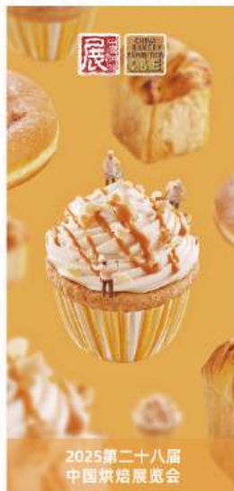
2025第二十八届中国烘焙展览会