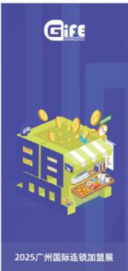
2025广州国际连锁加盟展