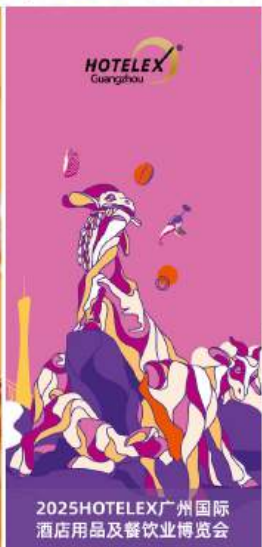
2025HOTELEX广州国际酒店用品及餐饮业博览会